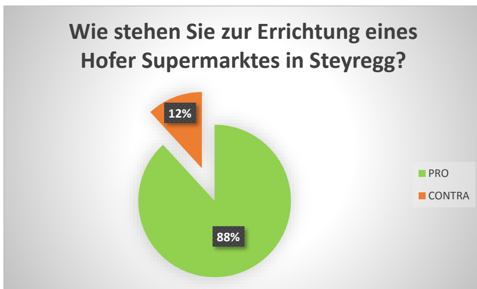
Grafik 2: Summarische Gruppierung der Antworten nach Pro/Contra. n=559

Summarisch dargestellt lässt sich sagen, daß 88% der Befragten einer Ansiedlung der Hofer KG in Steyregg positiv gegenüber stehen, und 12% ablehnend (Grafik 2).